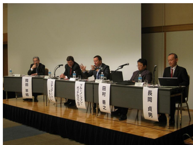
第二部：パネル・ディスカッション