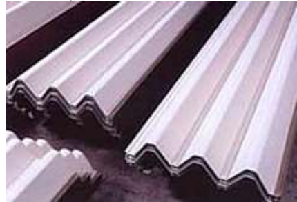
鋼材にはり付けた長尺屋根