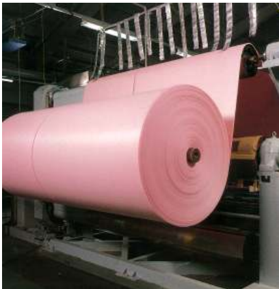
架橋高発泡ポリエチレンシート