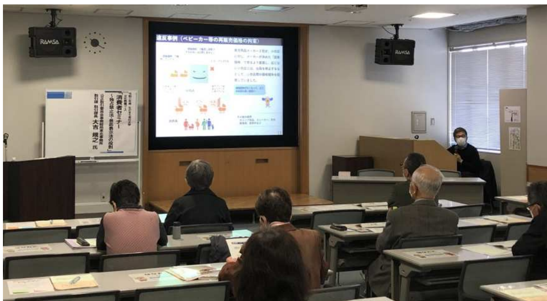
ながまち老壮大学（仙台市）（令和3年10月）

これらのセミナーにおいては、最近の違反事例の紹介を交えた景品表示法の意義・規制内容の説明を通じて、一般消費者等の理解増進を図り不当表示等による消費者被害の未然防止に努めた。