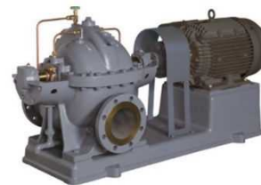
カスタムポンプの例