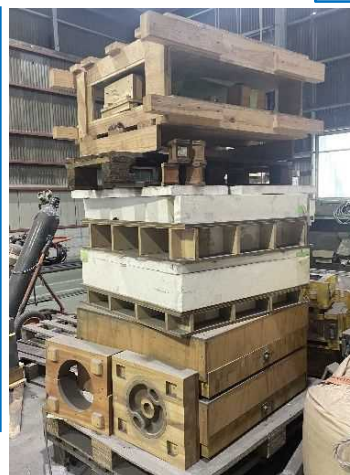
木型の実際の保管状況

※ (株)荏原製作所は、下請事業者に貸与している木型等について、保管費用支払等の手続を進めている。