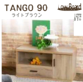
税抜 7,990円 90cm幅 TVボード TANGO 8,789円