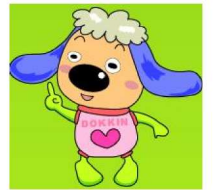
公正取引委員会キッズ向けキャラクター「どっきん」

当日は、ゲームで競争のメリットを体感してもらったり、食品における不当表示等の問題について、具体的な違反事例を紹介します！