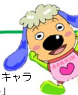
マスコットキャラ 「どっきん」