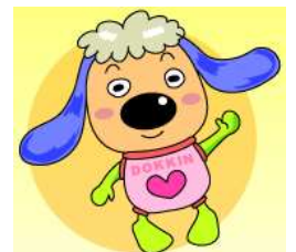
どっきん （公取マスコット キャラクター）