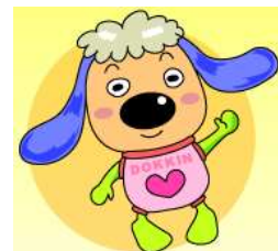
どっきん （公取マスコット キャラクター）