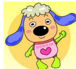
公正取引委員会 マスコットキャラクター どっきん