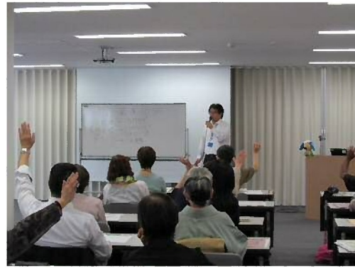
（名古屋市消費生活フェアの様相）