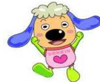
コウトリ星から地球の調査に来た宇宙人「どっさん」